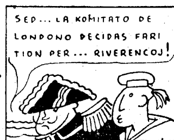
pro la blufo de London'