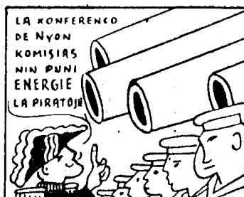
spite al akordo de Nyon