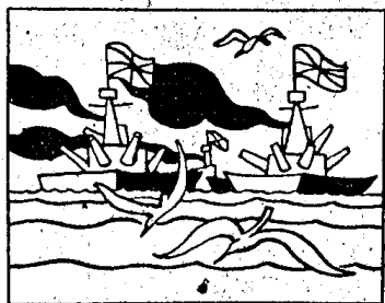
La reĝino de la maro