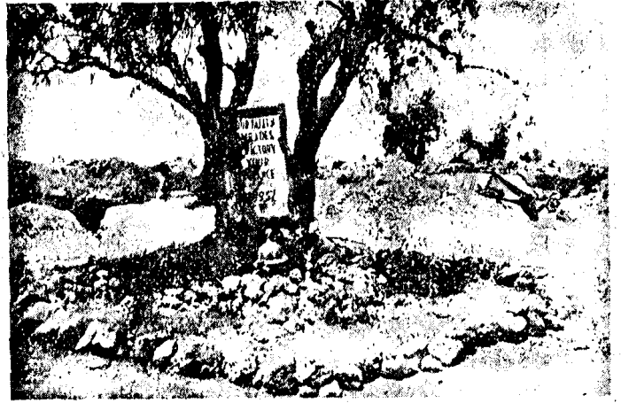
Se lu lordo parolas malŝate pri nia milito, la angla popolo ne faras tion. Jen simpla k emocia tombo de anglaj volontuloj falintaj, en sektoro najbara al Madrido, defendante la rajtojn de Hispanio k la liberon de la britaj laboristoj