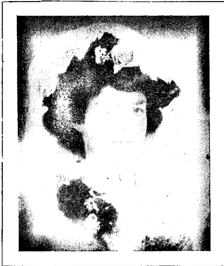
F-ino Julia Lacruz Utiel, (Valencia) Hispanujo

F-ino Lacruz, el Utiel, montras sian belan elegantan figuron sur la lokon de la sce-