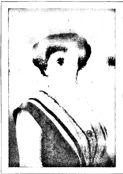
Sinjorino Klara de Zamenhof