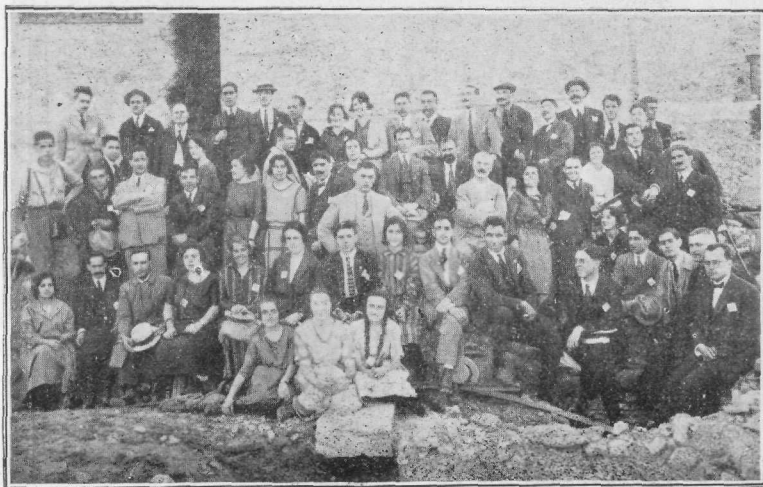
Partoprenantoj de la ekskurso al Empúries.