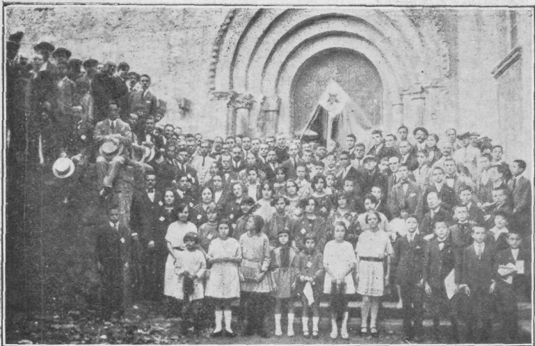
Kongresanoj ĉeestintaj la esperantan Diservon, antaŭ la pordo de Sant Pere de Galligans.